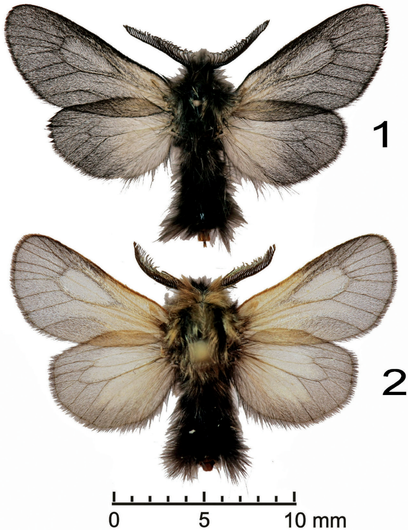
Slika 10: 1 - ♂ P. graslinella , ex.l.-ex.p., Dalnje Njive; 2 - ♂ P. praezellens , ex.l., Podgorski kras.