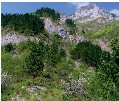
Sl. 3: Habitat vrste na pobočju nad vasjo Ribjek.