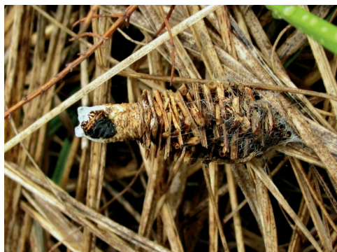
Sl. 6: Vrečka samčica P. graslinella (Dalnje Njive) v stadiju bube.