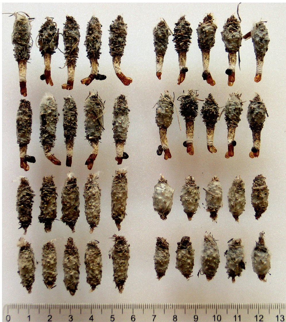
Sl. 9: Levo - vrečke P. praecellens (zgoraj ♂♂, spodaj ♀♀), desno - vrečke P. graslinella (zgoraj ♂♂, spodaj ♀♀).