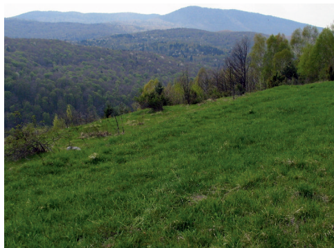
Sl. 2: Habitat vrste na lokaliteti Dalnje Njive.