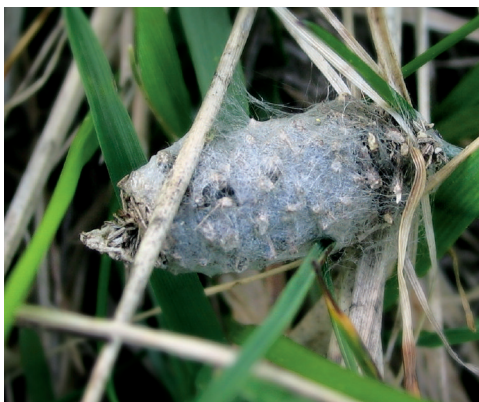
Sl. 7: Vrečka samičke P. graslinella (Dalnje Njive) v stadiju bube.

Zaradi medsebojne podobnosti in lažjega ločevanja dveh sorodnih vrst, smo naredili še primerjavo vrečk obeh spolov ter samčkov vrst P. graslinella in P. praecellens , ki je v Sloveniji razširjena na Primorskem in na Krasu. Ta sorodna