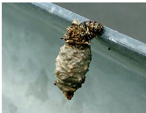
Sl. 4: Dorasla gosenica samičke P. graslinella na lokaliteti Dalnje Njive, med plezanjem po cestni varovalni ograji.

gosenic dolge približno 8 mm, po drugi prezimitvi so gosenice že v zadnji levitvi in z dokončno oblikovanimi vrečkami. Vrečke so pri obeh spolih prečno zgrajene iz majhnih travniških stebelc in bolj ali manj pokrite s fino, srebrno-sivkasto prejo, pri samčkih pa se zaključijo z daljšim izletnim tulcem bele barve. Gosenice moškega spola se v povprečju zabubijo osem dni prej kot gosenice samičk, vendar se metulji obeh spolov izležejo sočasno. Metulji se pojavijo od konca aprila do sredine junija, po Kusdasu in Reichlu (1974) pa zlasti v mesecu maju. Samčki se v naravi izležejo dopoldan in živijo zelo kratek čas. Aktivni so dopoldan, ko iščejo samičke, ki se nahajajo v svojih vrečkah, še v ovojnici bube (Hättenschwiler, 1997).