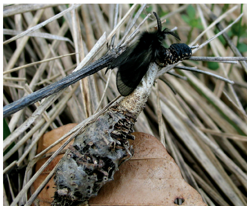
Sl. 8: Izlegel samček P. graslinella (ex.p., Dalnje Njive) počiva na svoji vrečki.