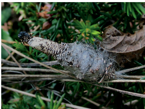
Sl. 5: Vrečka samčica P. graslinella (Ribjek) v stadiju bube.